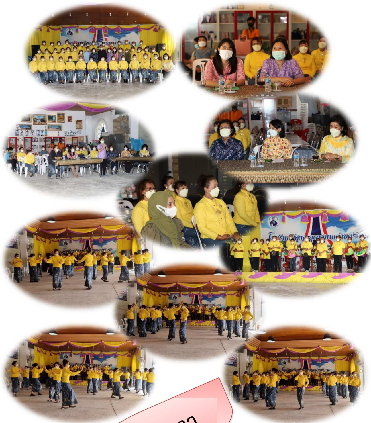
รำกลองยาว