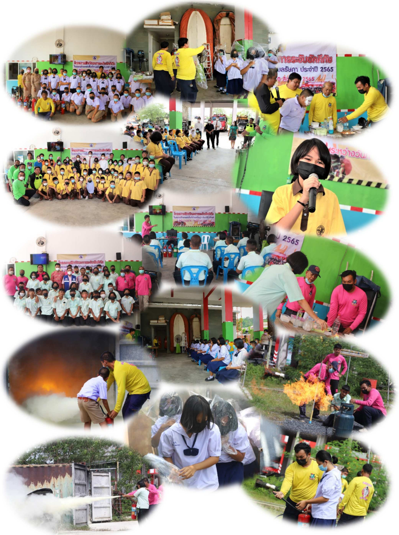
โครงการฝึกทักษะการระงับอัคคีภัย