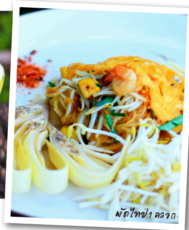
ผัดไทพริกขี้หนู